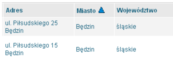
Ilustracja 7: uszeregowanie wg miasta