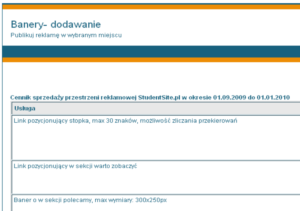
Ilustracja 15: Cennik usług na portalu StudentSite.pl

Na zakładce Zobacz cennik znajduje się aktualny cennik usług. Po wybraniu opcji skorzystaj z formularza kontaktowego dostępnego na zakładce kontakt . Bezpośredni link do formularza znajduje się pod cennikiem.