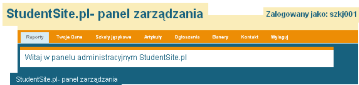
Ilustracja 2: Strona główna panelu zarządzania

Po udanym logowaniu zostaniesz przeniesiony na stronę główną panelu. Na tej stronie znajdziesz ważne informacje od administratora.