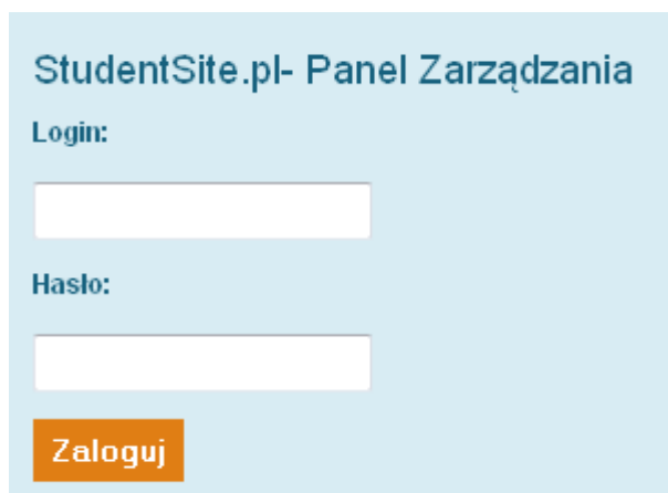
Ilustracja 1: Formularz logowania

Panel zarządzania udostępniono pod adresem http://beta.studentsite.pl/panel/