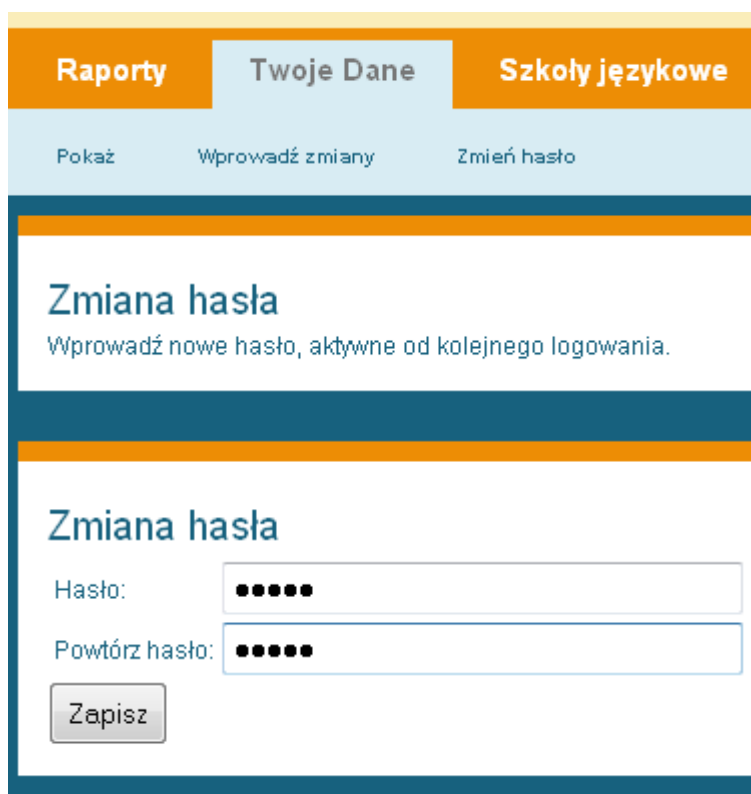
Ilustracja 5: Zmiana hasła w panelu zarządzania

Zawsze możesz również zmienić hasło do Twojego profilu. Aby tego dokonać wybierz opcję Zmień hasło znajdującą się na zakładce Twoje dane .