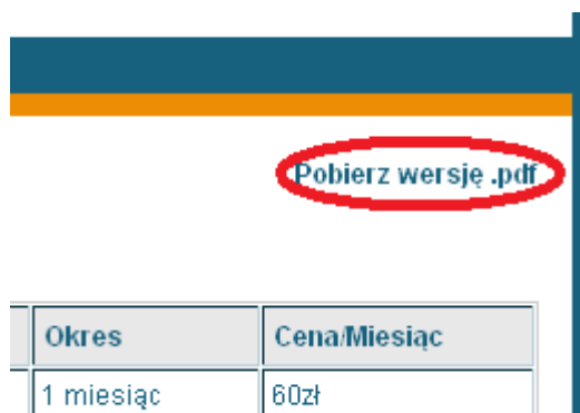
Ilustracja 16: Pobierz plik .pdf na swój komputer

Zawsze możesz pobrać wersję PDF na swój komputer.